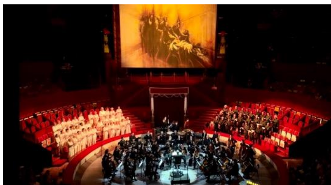
Création 2022, La Passion selon Marie , opéra-oratorio – Cirque d'Hiver, Paris